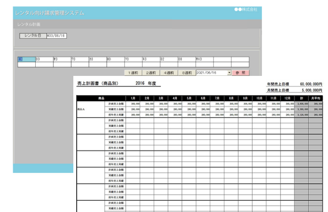
※出力帳票はお客様のお好みにカスタマイズが可能です。