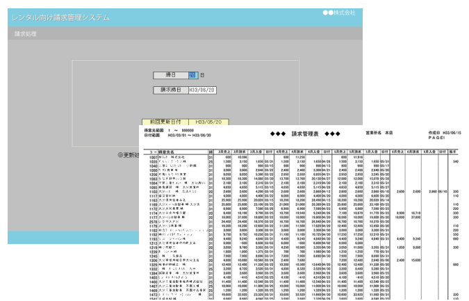
※出力帳票はお客様のお好みにカスタマイズが可能です。